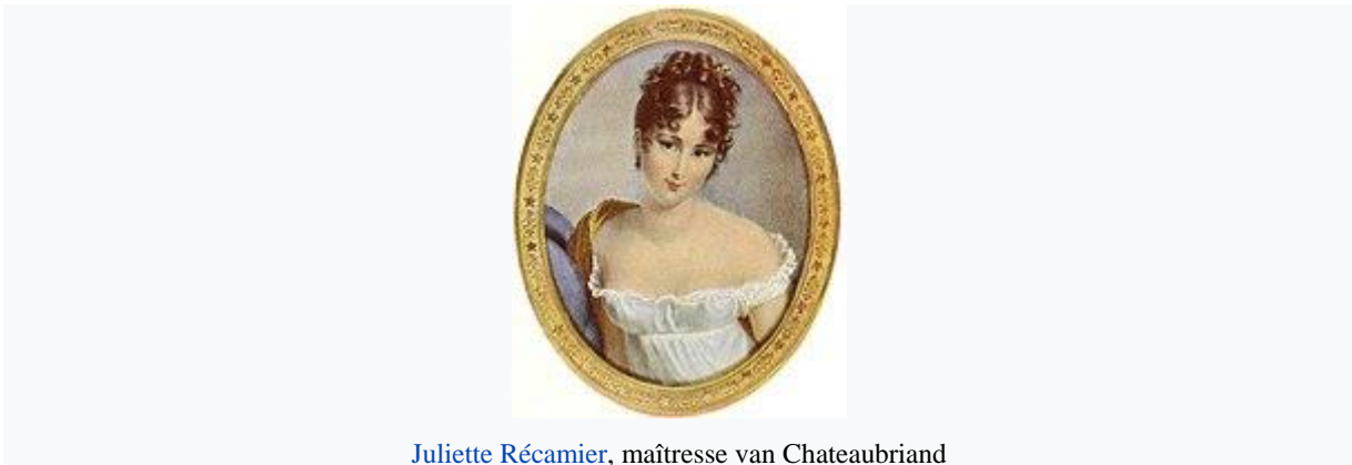
Juliette Récamier , maîtresse van Chateaubriand

Chateaubriands ideeën bevielen Napoleon Bonaparte , die hem in 1803 benoemde tot eerste gezantschapssecretaris te Rome en in 1804 tot gevolmachtigd minister in Wallis . In 1804 , na de terechtstelling van de hertog d'Enghien, nam hij echter ontslag en nam hij afstand van het keizerlijke Frankrijk. Twee jaar later ging hij op reis en bezocht Griekenland , Klein-Azië , het "Heilige Land" ( Palestina ), Noord-Afrika en Spanje . Deze omzwerving diende als stof voor zijn werken Les Martyrs ( 1809 ) en Itinéraire de Paris à Jérusalem ( 1811 ). In 1811 werd hij verkozen tot de Académie française .